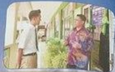
يُتَرَبِّتُ الْمُعَلِّمُ الشَّرِيفُ الْعُلَمَاءَ فِي الْإِقَارَةِ الْعَالِيَةِ