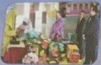
يُقِيمُ الشُّبُهَرُ وَمُسَاعَدَةُ الشُّبُهَرِ الْكُنْهَانَ الْعُلَمَاءَ فِي الْبِنَاءِ الْبَارِعِ