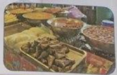
تُسْتَعَدُّ التُّوَادِي وَالْحَمْعِيَّاتُ بِالْمَأْكُولَاتِ وَالْمَشْرُوبَاتِ وَالْبِضَاعِ الْمَبِيَّةِ