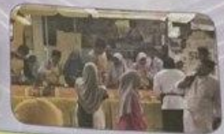
تَقُومُ الْمُدْرِسَةُ بِيَوْمِ الْبِقُصْفِ لِتُكْتَسِبَ الْعَلَمَةَ الْخَيْرَةَ الْعَهْمِيَّةَ