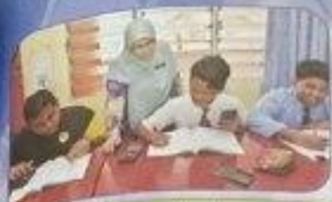
تُوجِّهُ الْمُدْرِسَةُ الْعُلَمَاءَ فِي تَحْقِيقِ الْحَاجَاتِ