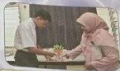
تُعْرِضُ الْمُتَرْشِدَةُ الْعُلَمَاءَ إِسْتِخْدَامَ الْمَرْكَبِ