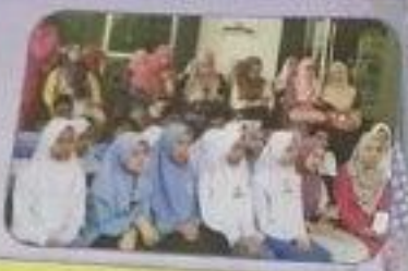
يُخَضِّرُ الْأَيَّامَ وَالْأَهْمِيَّاتُ تُشْجِعُوا الْبِنَاءَ فِي الْأَسْبَعَةِ الْبَارِعَةِ